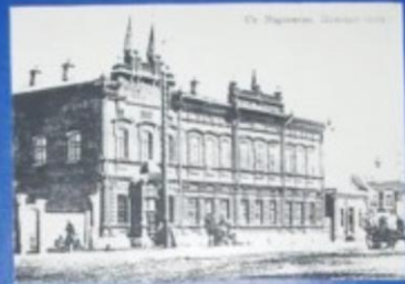
1930 год. Железная гимназия. Было сделано пристройка.