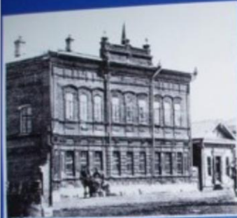
1902 год. Железная гимназия.