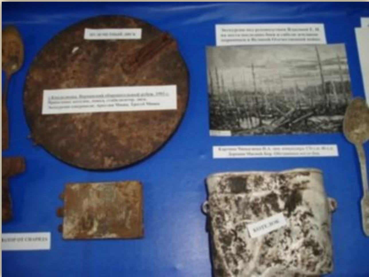
1911-1912 гг. (1911-1912 гг.)