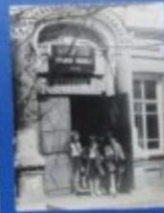
1977 год. Средняя школа № 2.