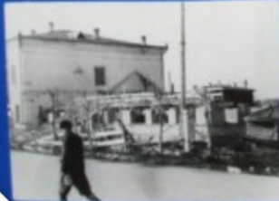
1965 год. Средняя школа № 2, было сделано пристройка.