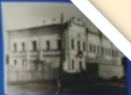
1968-е годы. Средняя школа № 2.